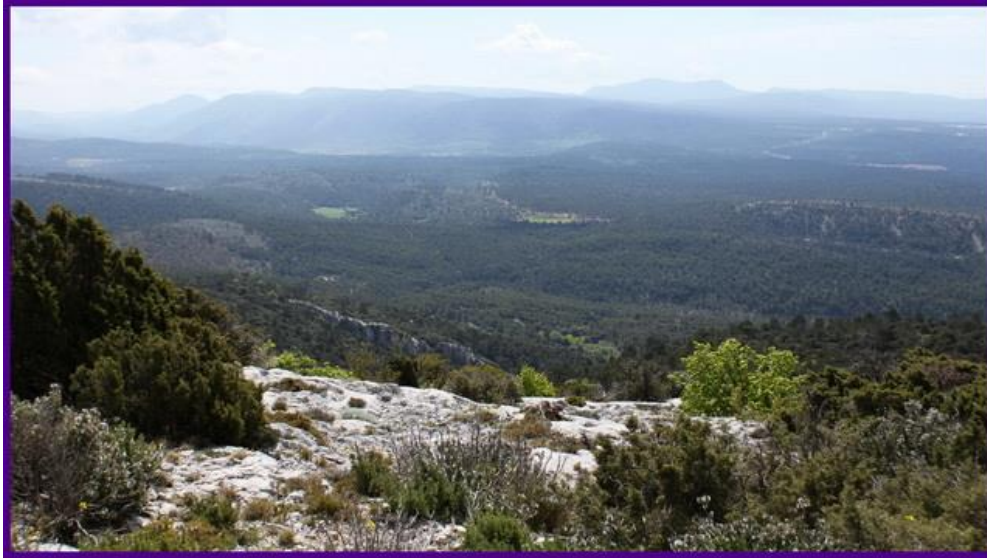
Le Domaine de l'Université de la Baume, vue depuis le rocher de Tiyi. Pour l'IGN, c'est le rocher de la Colle Blanche, plein Sud devant la chapelle du saint-Pilon...