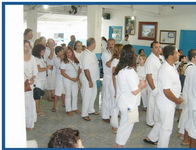
La file d'attente se forme...

Comme il est de bonne heure, histoire de m'y préparer, j'en profite pour faire un bain de cristal de 20 minutes. Totalement détendu, je retourne ensuite à la Pousada pour le repas de midi. Mais pendant le repas, la question se pose en moi de savoir si je dois me contenter d'une opération invisible comme 98 % des gens ou alors si je dois demander une seconde opération visible par Joao alors que ma requête est totalement spirituelle... Dilemme.